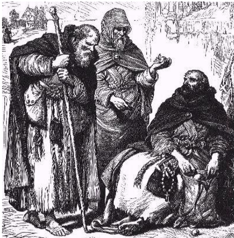
Groupe de moines mendiants au Moyen Âge – ceux-ci représentaient la principale source d'inquisiteurs (Dominicains, Franciscains), ainsi que les cibles de l'Inquisition (Cathares pefecti, Vaudois, Fraticelli, etc.) (Gravure de Wylie)

Alors que les Cathares constituaient la cible privilégiée de l'Inquisition (à tel point que le mot «Cathare» fut employé comme synonyme d'«hérétique» pendant de longues années), l'étendue de l'Inquisition papale inclus de plus en plus d'autres groupes. Finalement, les victimes furent également les Vaudois, les Fraticelli (un groupe sécessionniste des Franciscains), les Templiers et, plus tard, les Protestants.