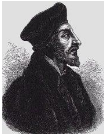
Jan Hus (c. 1369–1415)

Jan Hus est né à Husinec, en Bohême vers 1369. En 1401, il fut ordonné prêtre, mais se heurta rapidement aux autorités ecclésiastiques en raison de ses vues théologiques. Celles-ci furent d'ailleurs reprises par les Protestants quelques 100 ans plus tard.