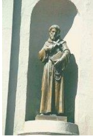
Statue de St. François d'Assise

L'histoire de François est très analogue à celle de Pierre Valdo, mais l'un fut canonisé (François, en 1228) alors que l'autre fut excommunié (Valdo, en 1184). François, tout en menant une vie de moine mendiant, a simplement toujours accepté l'autorité de l'Église. Il est mort en 1226, des années avant que Grégoire IX n'engage son ordre au service de l'Inquisition.